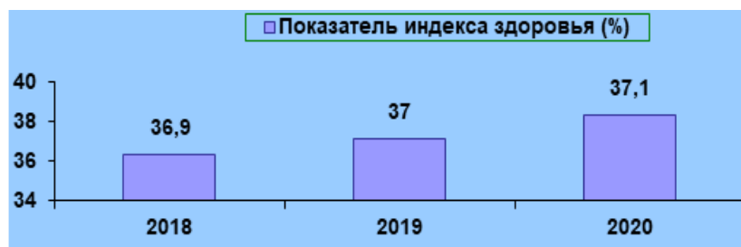
Показатель индекса здоровья в ДОО с 2018 – 2020гг

Анализ нижеуказанных показателей за период 2018-2020 годы, подтверждает результативность и эффективность проводимых мероприятий в рамках реализации программы. Индекс здоровья по сравнению с 2019 годом, увеличился на 0,1% .